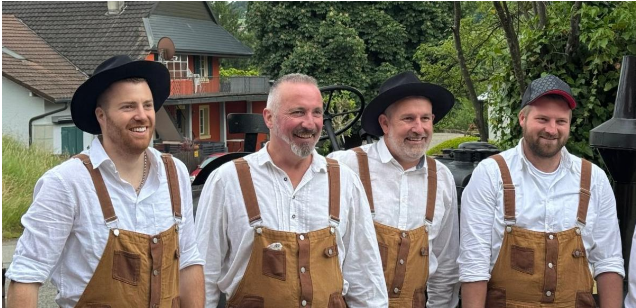
Einige der Fulenbacher Enthusiasten in authentischer Kleidung