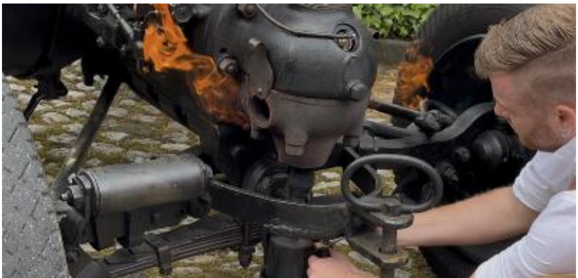
Der Glühkopf in Aktion, beim Aufheizen mit der Lötlampe vor dem Anwerfen

Technik-Interessierte sind vom urtümlichen Motor des Traktors fasziniert: es handelt sich um einen Glühkopfmotor. Der Glühkopfmotor ist kein Dieselmotor, da er auf Fremdzündung angewiesen ist (via erhitztem Glühkopf oder später mit Zündkerze).