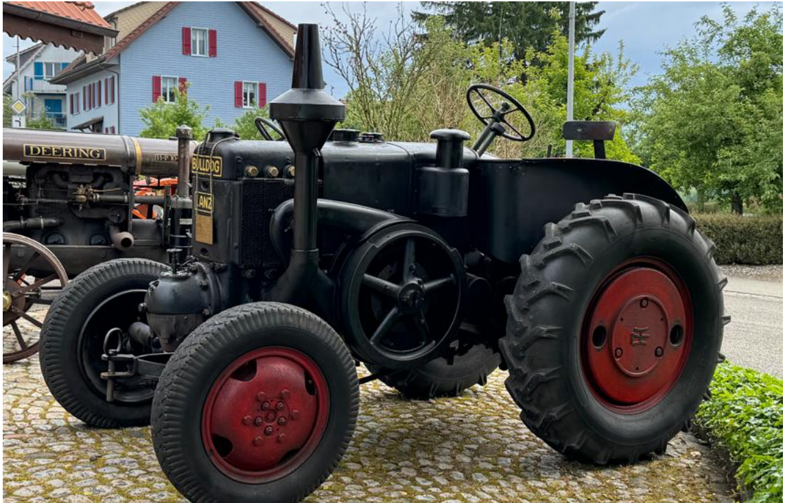
Der Bulldog mit dem massiven Schwungrad – präsentiert in Fülenbach

Technik-Interessierte sind vom urtümlichen Motor des Traktors fasziniert: es handelt sich um einen Glühkopfmotor. Der Glühkopfmotor ist kein Dieselmotor, da er auf Fremdzündung angewiesen ist (via erhitztem Glühkopf oder später mit Zündkerze).