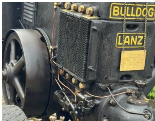
Bulldog - heute, mit Stifterplakette der Herren Jäggi aus Fulenbach